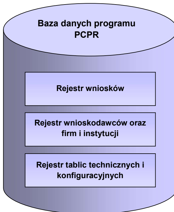
Rysunek 2. Struktura bazy danych.

Ogólny schemat struktury bazy danych przedstawiony jest na Rysunku 2.